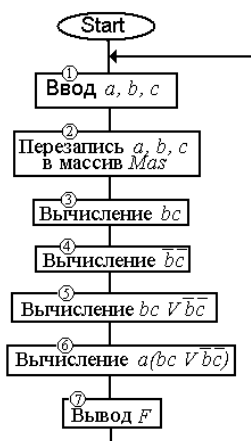
Рис.2. Алгоритм непосредственного решения ФАЛ

Метод непосредственного вычисления функций алгебры логики обладает простотой и наглядностью, размер программ и время их вычисления определяются сложностью конкретных булевых формул.