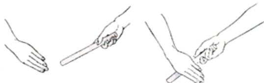
Рис. 2. Передача палочки

Методические указания. Выполнять в парах, меняться после каждой передачи, передающий выходит вперед.