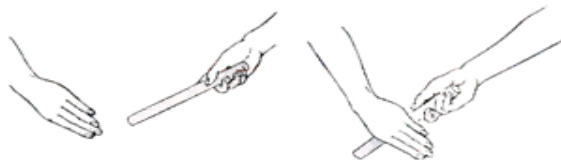
Рис. 2. Передача палочки

Упражнение 2. Передача палочки из правой руки в левую на месте по сигналу передающего. Методические указания. Выполнять в парах, меняться после каждой передачи, передающий выходит вперед.