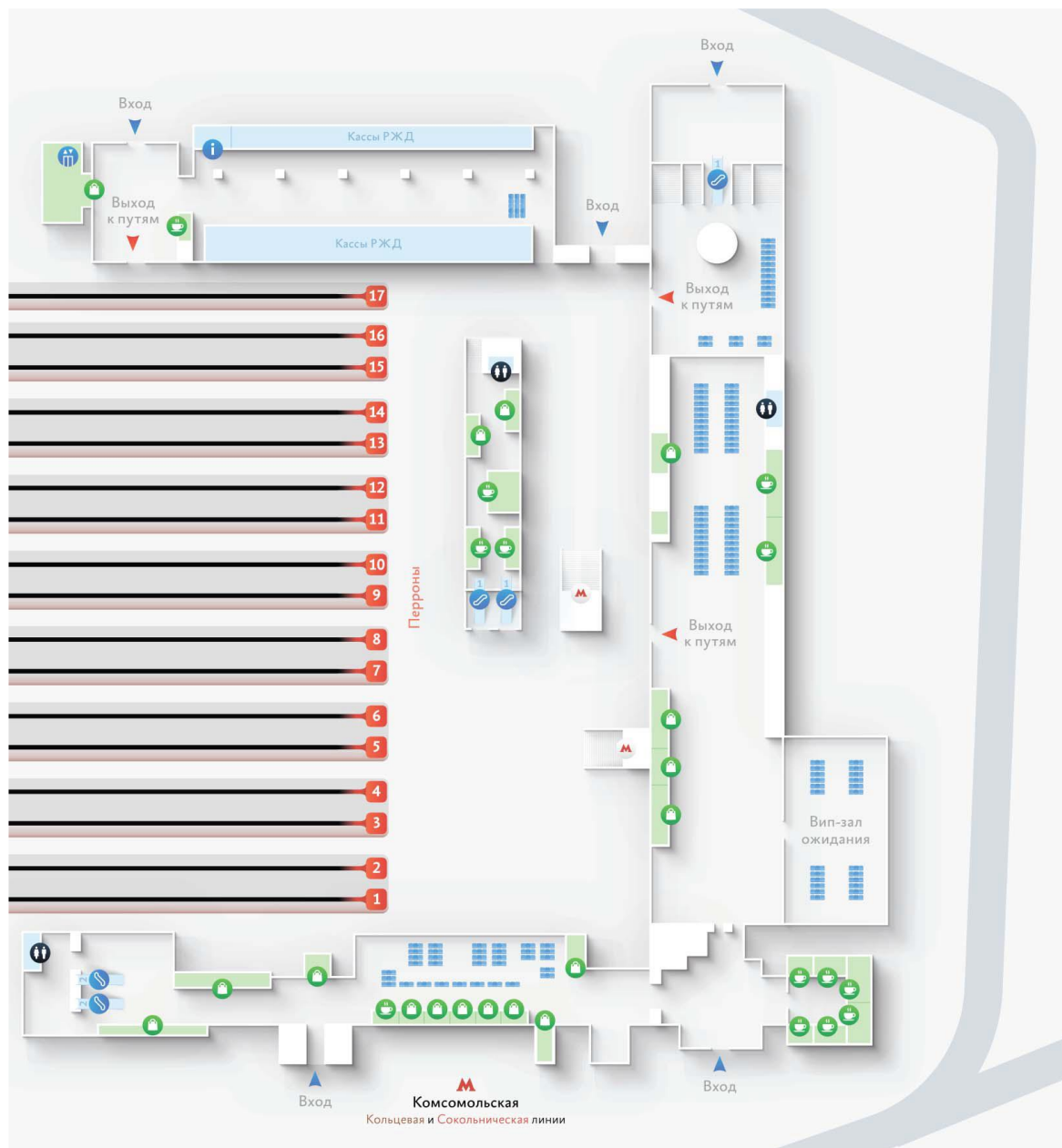
Рисунок 1.1 – Схема Казанского вокзала

Для заданного вокзального комплекса разрабатывается ряд мероприятий и выбирается маршрут беспрепятственного следования маломобильного пассажира согласно СТО РЖД 03.001-2014.