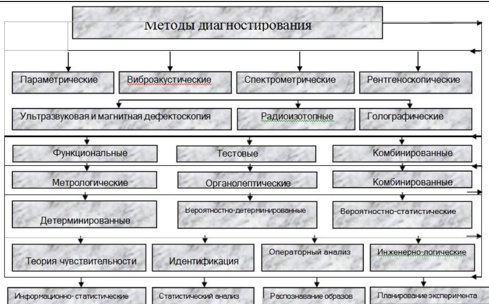
Рис 2. Выбор методов диагностирования

ПК-6.1 Принимает управленческие решения на основе интеллектуального анализа показаний средств диагностики локомотивов, с использованием современных цифровых технологий